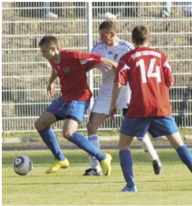
Raków znów nie pozwolił Górnikowi na zdobycie gola.