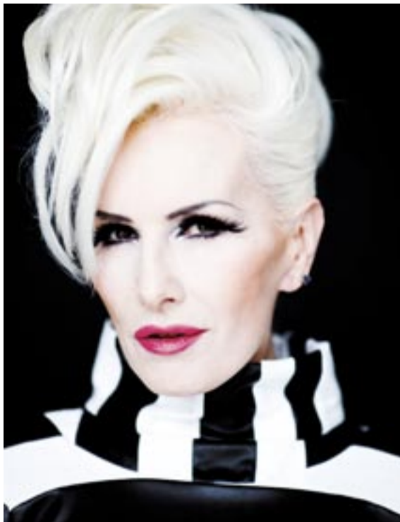
15 kwietnia Kora zaśpiewa w Wałbrzychu.

Każda płyta Kory to wielkie przeboje z doskonałymi tekstami i świetną muzyką. Do największych hitów należą m.in.: Boskie Buenos, Karuzela marzeń, Oddech szczeniaka, Kocham cię kochanie moje, Szał niebieskich ciał, Luciolla, Lipstick on the glass, Róża, Bez ciebie umieram. Koncerty tej artystki to niepowtarzalne show pełne dynamiki z zaskakującą oprawą scenograficzną. Biorąc pod uwagę fakt ogromnej popularności KORY na koncerty przychodzi z różnicowaną wiekowo publicznością. Dopelnieniem jej artystycznej działalno-