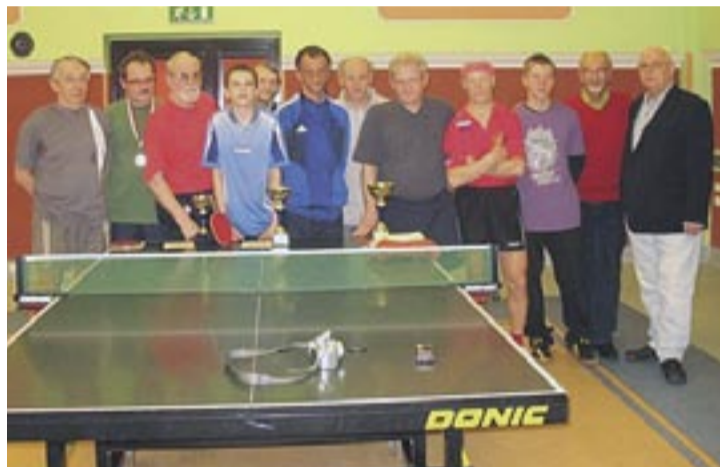
Najlepsi w ostatnich rozgrywkach.