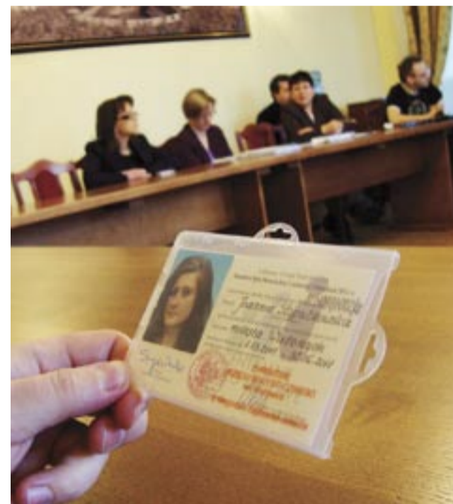
Każdy ankieter musi mieć legitymację ze zdjęciem.

W tym roku GUS postanowił sprawdzić też populację osób bezdomnych. Oprócz schronisk i noclegowni, ankieterzy pojawią się w miejscach, gdzie zazwyczaj gromadzą się ludzie, nie posiadający dachu nad głową. Pomoże w tym straż miejska.