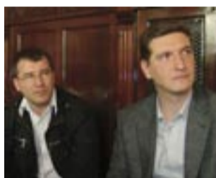
Związkowcy z Solidarności pilnie przysłuchiwali się obradom.

Po wielogodzinnej dyskusji, radni Rady Miejskiej Wałbrzycha uchwalili podwyżkę cen biletów komunikacji miejskiej. Od czerwca, zamiast 2,20 zł, za bilet trzeba będzie zapłacić 2,40 zł. Nie będzie jednak drastycznego zwiększenia ceny biletów socjalnych, z których korzystają osoby najuboższe.