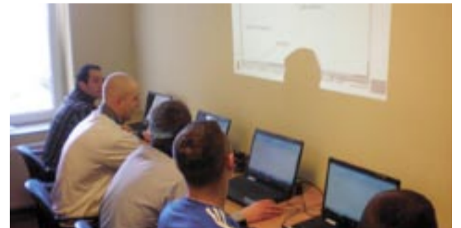
Uczestnicy kursu podczas nauki komputerowych programów magazynowych.